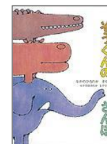
『そうくんのさんぽ』 なかの ひろたか/著 福音館書店