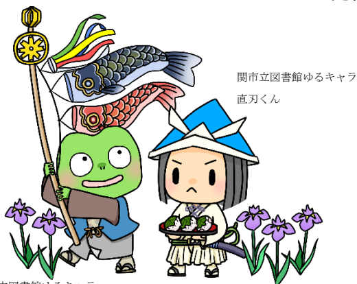
関市立図書館ゆるキャラ 直刃くん