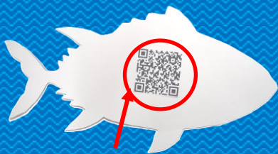
うら でんししょせき 裏に電子書籍!