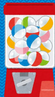
ガチャガチャにもチャレンジ!